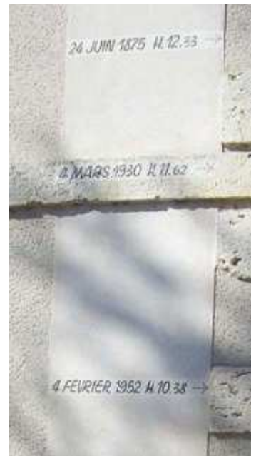
Marques de crues à l'entrée du Conseil départemental

S.CO.T AGENAIS 19 COMMUNES CONCERNÉES ZONE INONDABLE PPRI GARONNE 1875